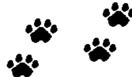
Tabla del Contenido:

El encintado amarillo es solamente para el subir y el bajar de los pasajeros. Los empleados de la escuela no pueden poner arena ni quitar la nieve si hay carros estacionados en estas zonas. Aunque hemos permitido el estacionar de los carros en estas zonas hasta ahora, favor de empezar a usar solamente el estacionamiento o la calle.